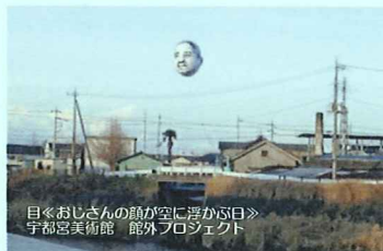
目《おじさんの顔が空に浮かぶ日》 宇都宮美術館 館外プロジェクト