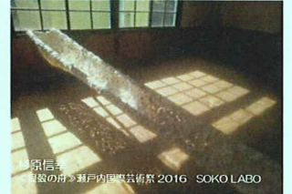
泉信幸 《望の舟》瀬戸内国際芸術祭 2016 SOKO LABO