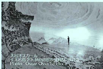
大岩オスカル 《大岩島 2》瀬戸内国際芸術祭 2013 Photo: Oscar Ojiva Studio

◇料金/大人 6,800 円・高校生 5,300 円・小中学生 4,800 円(鑑賞パスポート・案内ガイド付・昼食代は別途必要)