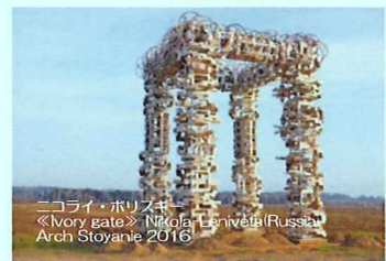
ニコライ・ホリスキ 《Ivory gate》Nikolai Esniveria (Russia) Arch Stoyanie 2016