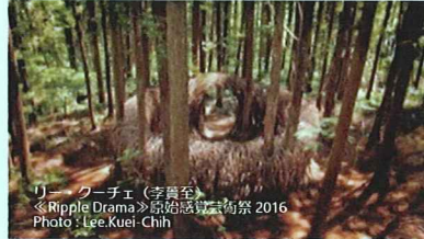
リー・クーチェ (李貴至) 《Ripple Drama》原始総算芸術祭 2016