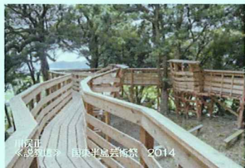
川俣正 《Inesado Passare》国際芸術祭 2014

信濃大町駅 11:10 == 大町温泉郷 11:25 == エコパーク (川俣正) == 源流エリアにて昼食 == 大町温泉郷 (大岩オスカル・新津保建秀・ヴィルツカラ・大平由香理) == 宮の森 (遠藤利克・平田五郎) == エネルギー博物館 (浅井裕介・栗田宏一・岡村桂三郎) == 仏崎観音寺 (ジェームズスタップスコット) == 大町温泉郷 16:25 == 信濃大町駅 16:45 【所要時間約 5 時間 30 分】