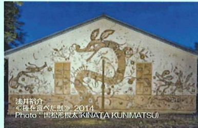
浅井裕介 《龍を食べた日》2014