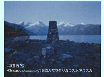
平田五郎 《Inesado Passare-月を盗んだワタリガラス》アラスカ